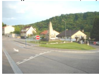
Aménagement carrefour Rue de Gorze (2005)