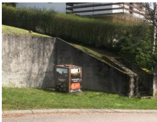
Conteneur Rue de Gorze

Le tri des biodéchets rencontre un véritable succès sur la commune d'Arnaville : 90% de remplissage pour les points du parking de la Vème Division et Rue de la Gare ; 70% pour la Grande Rue à l'entrée en venant de Bayonville et à l'entrée de la rue du Mad.