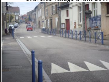
Traverse village actuelle voitures sur la chaussée, piétons à l'abri sur les trottoirs

Site internet de la commune d'Arnaville : http://www.arnaville.mairie54.fr