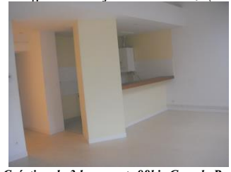
Création de 3 logements 98bis Grande Rue (2004)