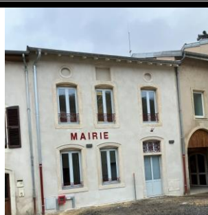
2023 : Nouvelle Mairie