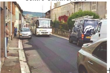
Traverse village avant 2009