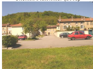
Parking de la Vème Division (2002)