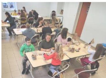
Atelier du samedi après-midi

Le vendredi 5 décembre 2025 à partir de 18h30, au Centre Culturel, les enfants de l'école d'Arnaville accompagnés de leurs enseignants et des parents d'élèves élus, vous convient à la Fête de St Nicolas organisée au profit de la coopérative scolaire : Chants, animations, restauration sauront vous conduire dans le monde féérique des fêtes de fin d'année. Venez nombreux, parents, grands-parents, voisins, amis, habitants d'Arnaville.