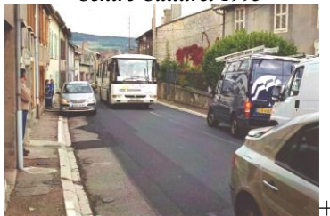
Traverse village avant 2009