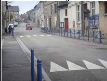
Traverse village actuelle voitures sur la chaussée, piétons à l'abri sur les trottoirs