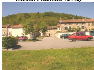
Parking de la Vème Division( 2002)