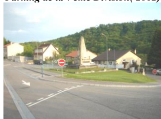
Aménagement carrefour Rue de Gorze (2005)