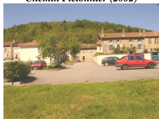
Parking de la Vème Division( 2002)