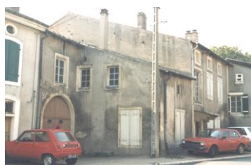
Presbytère avant 1990