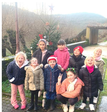
Les enfants de l'école ont décoré le sapin

Adresse internet de la Mairie : mairiearn@numericable.fr Téléphone : 03.83.82.62.78