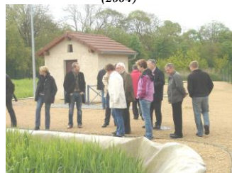
Station d'épuration (2007)