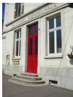
réhabilitation école communale (2011) et périscolaire (2015)