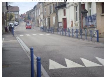
Traverse village actuelle voitures sur la chaussée, piétons à l'abri sur les trottoirs