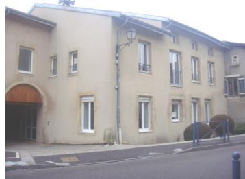
Centre Culturel 1993