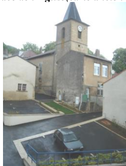
Place de l'Eglise 2009