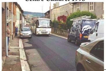
Traverse village avant 2009