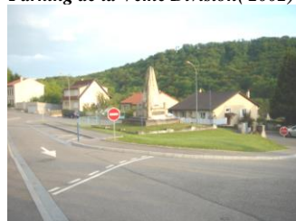
Aménagement carrefour Rue de Gorze (2005)