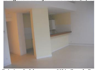
Création de 3 logements 98bis Grande Rue (2004)