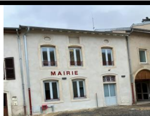
2023 :Nouvelle Mairie

Réalisation familiale -Cloé Bumberger au dessin -Patrick Fosset à la réalisation -Aurélie Besnard à la peinture.