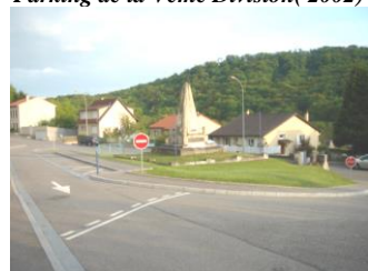
Aménagement carrefour Rue de Gorze (2005)