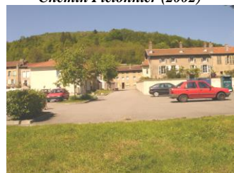
Parking de la Vème Division( 2002)