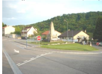
Aménagement carrefour Rue de Gorze (2005)