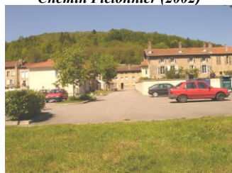
Parking de la Vème Division( 2002)