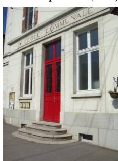
réhabilitation école communale (2011) et périscolaire (2015)