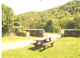
Chemin Piétonnier (2002)