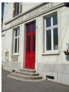
réhabilitation école communale (2011) et périscolaire (2015)