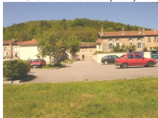
Parking de la Vème Division( 2002)