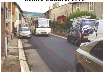
Traverse village avant 2009