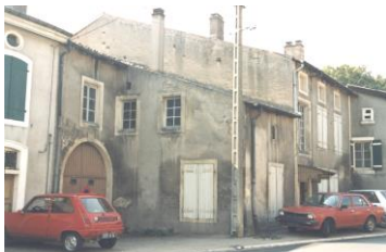
Presbytère avant 1990