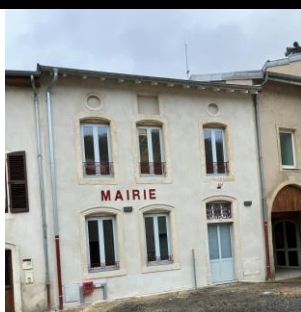
2023 :Nouvelle Mairie

Ces dates sont susceptibles d'évoluer et d'être complétées.