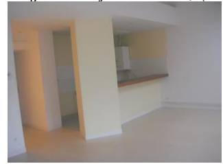
Création de 3 logements 98bis Grande Rue (2004)