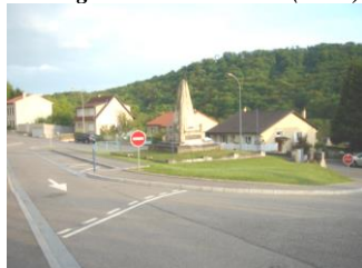
Aménagement carrefour Rue de Gorze (2005)