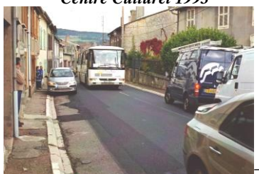
Traverse village avant 2009