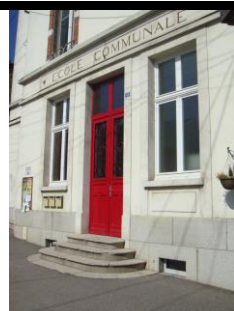
réhabilitation école communale (2011) et périscolaire (2015)

Ces dates sont susceptibles d'évoluer et d'être complétées.