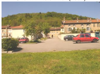
Parking de la Vème Division( 2002)