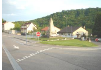
Aménagement carrefour Rue de Gorze (2005)