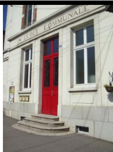
réhabilitation école communale (2011) et périscolaire (2015)

Ces dates sont susceptibles d'évoluer et d'être complétées