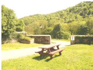
Chemin Piétonnier (2002)