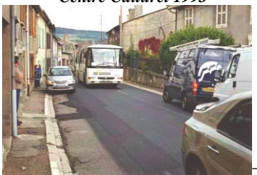
Traverse village avant 2009