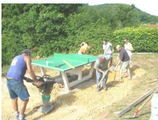
Mise en place de la table de ping pong (2009) aire de jeux et terrain de basket (2013/2014)