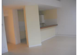
Création de 3 logements 98bis Grande Rue (2004)