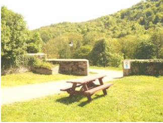
Chemin Piétonnier (2002)