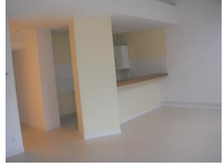
Création de 3 logements 98bis Grande Rue (2004)