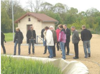
Station d'épuration (2007)