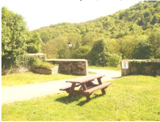
Chemin Piétonnier (2002)