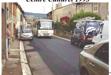
Traverse village avant 2009