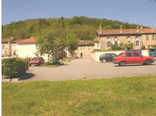
Parking de la Vème Division( 2002)