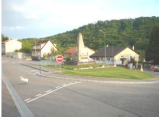
Aménagement carrefour Rue de Gorze (2005)