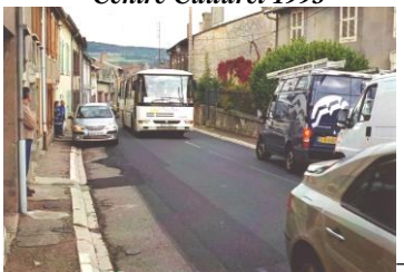
Traverse village avant 2009