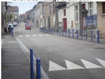
Traverse village actuelle voitures sur la chaussée, piétons à l'abri sur les trottoirs