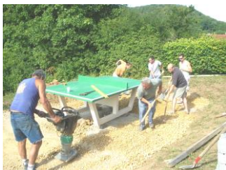
Mise en place de la table de ping pong (2009) aire de jeux et terrain de basket (2013/2014)