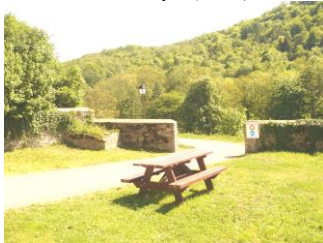
Chemin Piétonnier (2002)