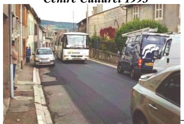
Traverse village avant 2009