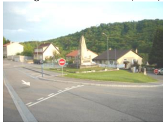
Aménagement carrefour Rue de Gorze (2005)