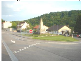
Aménagement carrefour Rue de Gorze (2005)