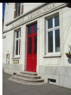
réhabilitation école communale (2011) et périscolaire (2015)

Merci aux décoratrices toujours à l'œuvre et très imaginatives.