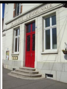
réhabilitation école communale (2011) et périscolaire (2015)

Nous espérons que les manifestations reprendront de façon régulière en 2021. Nous ne pouvons donner des dates définitives, le calendrier sera revu au fil du temps.