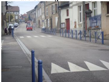
Traverse village actuelle voitures sur la chaussée, piétons à l'abri sur les trottoirs