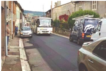
Traverse village avant 2009