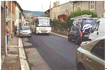
Traverse village avant 2009