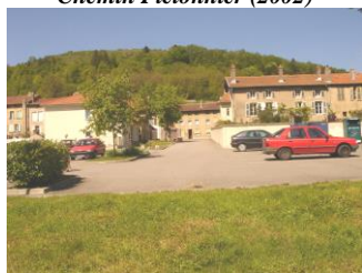
Parking de la Vème Division( 2002)