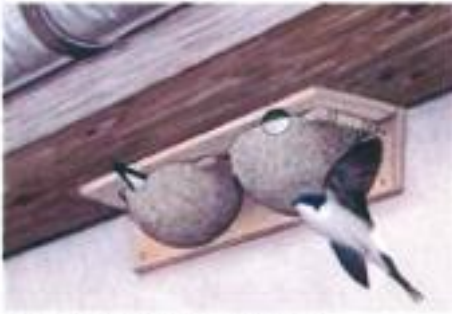
Nids à hirondelles de fenêtre.

Avec le retour des beaux jours on entend à nouveau le piaaillement des oiseaux dans les forêts mais également dans nos villages. Malgré tout, le déclin de leur population nous incite à être vigilants et ce, principalement lors de travaux de démolition, rénovation, réfection de toitures ou ravalement de façade. Ces travaux ne pourront être exécutés qu'entre octobre et mars.