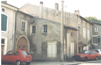
Presbytère avant 1990