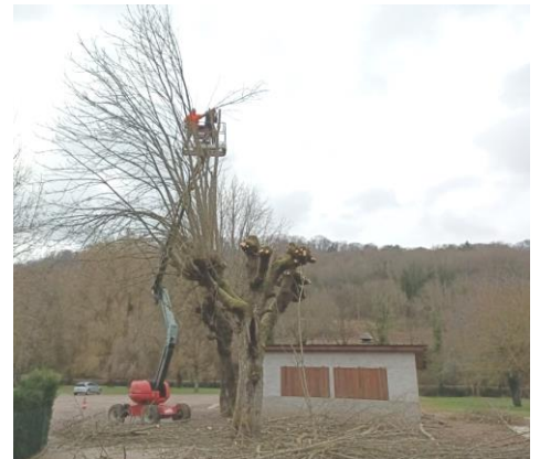
Après la taille

La place est maintenant prête à accueillir les fêtes villageoises.