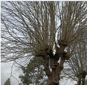
Avant la taille

Début mars, les marronniers de la Place des Fêtes ont été toilettés.