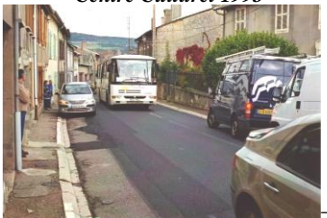
Traverse village avant 2009