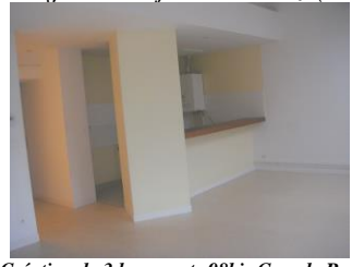
Création de 3 logements 98bis Grande Rue (2004)