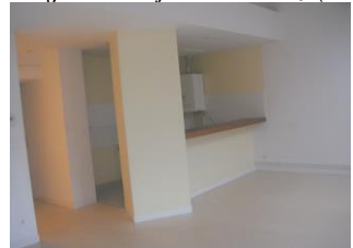
Création de 3 logements 98bis Grande Rue (2004)