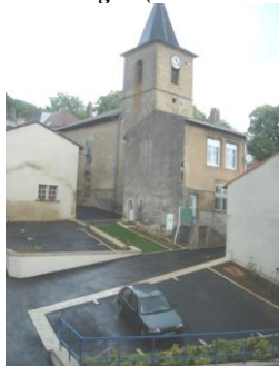
Place de l'Eglise 2009