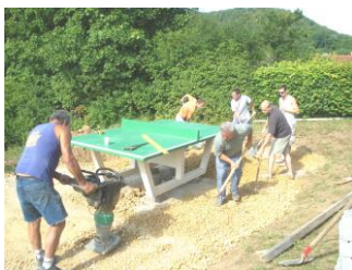
Mise en place de la table de ping pong (2009) aire de jeux et terrain de basket (2013/2014)