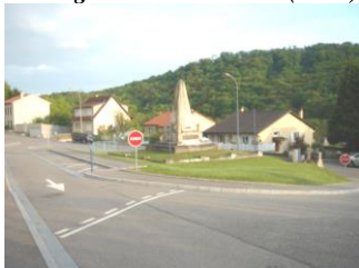
Aménagement carrefour Rue de Gorze (2005)