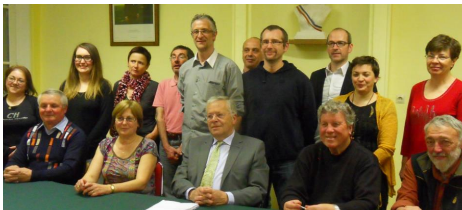
L'équipe de son dernier mandat 2014-2020