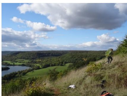
Suppression des chênes à l'ouest du « pin »