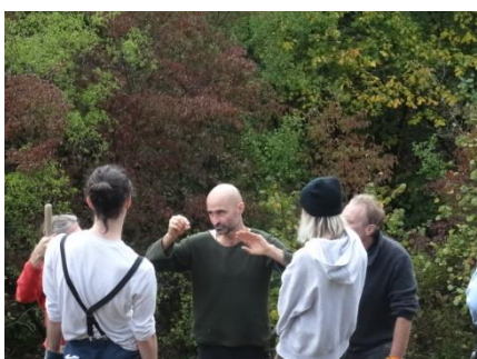
Animation « naturaliste »