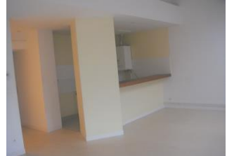
Création de 3 logements 98bis Grande Rue (2004)