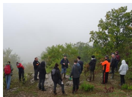
Conférence archéologique et de lecture des paysages au démarrage