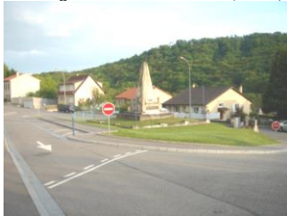
Aménagement carrefour Rue de Gorze (2005)