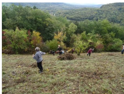
Au travail !