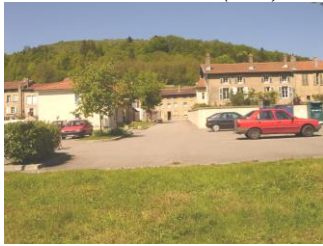
Parking de la Vème Division( 2002)