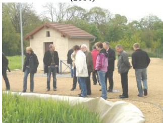
Station d'épuration (2007)