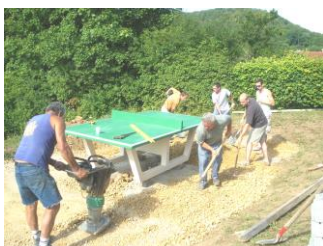
Mise en place de la table de ping pong (2009) aire de jeux et terrain de basket (2013/2014)