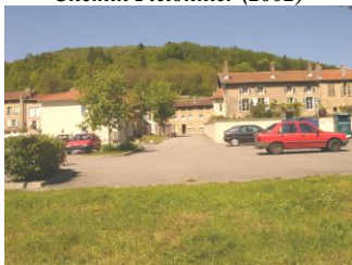
Parking de la Vème Division( 2002)