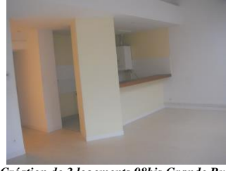
Création de 3 logements 98bis Grande Rue (2004)