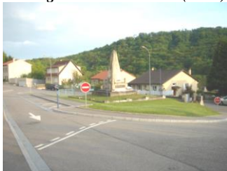
Aménagement carrefour Rue de Gorze (2005)