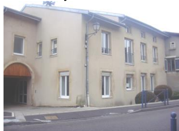
Centre Culturel 1993