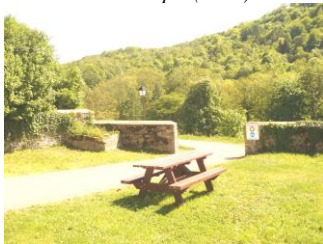
Chemin Piétonnier (2002)