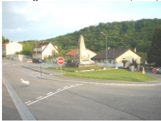
Aménagement carrefour Rue de Gorze (2005)