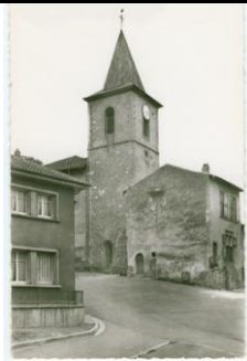
Place de l'Eglise(cartes ancienne)