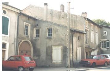
Presbytère avant 1990