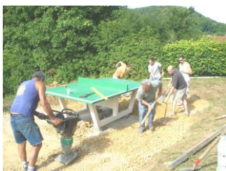
Mise en place de la table de ping pong (2009) aire de jeux et terrain de basket (2013/2014)