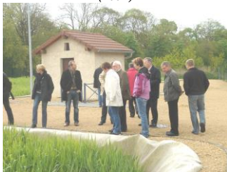
Station d'épuration (2007)