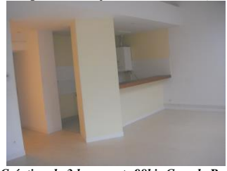
Création de 3 logements 98bis Grande Rue (2004)