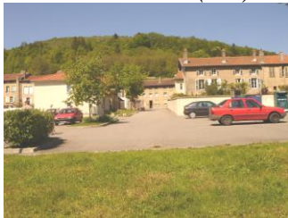
Parking de la Vème Division( 2002)