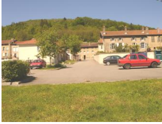
Parking de la Vème Division( 2002)