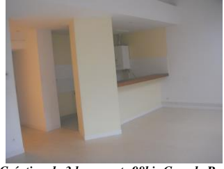
Création de 3 logements 98bis Grande Rue (2004)