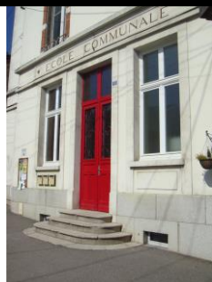
réhabilitation école communale (2011) et périscolaire (2015)